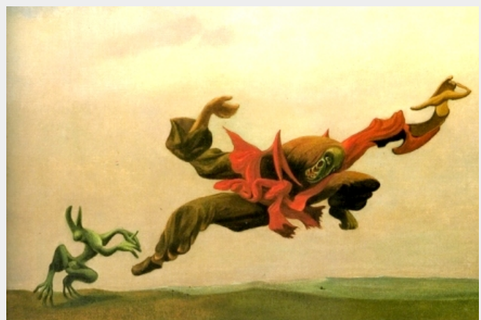
Une autre version de L'Ange du foyer , 1937